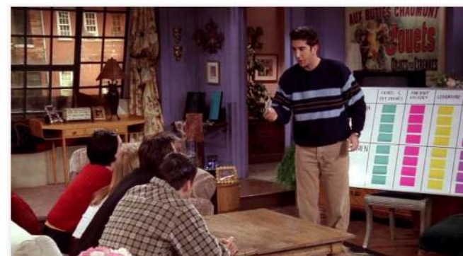
Гид по английскому

ПАРТНЕР: косметика Mavala (Швеция) ЗАДАЧА: рассказать о средствах для рук. ИДЕЯ: акушер, ювелир, флорист и др. рассказывают о работе руками, получают экспертные советы.