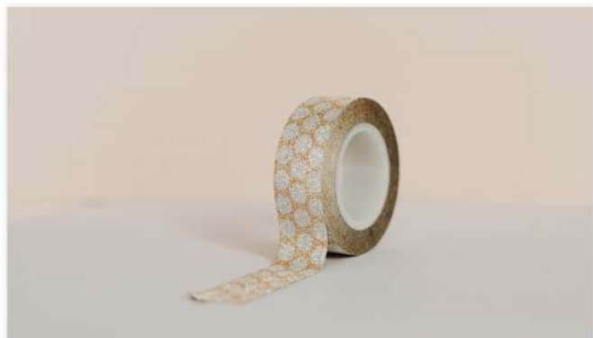
30 подарков к Новому году не дороже 1000 рублей

ПАРТНЕР: языковая школа ISay ЗАДАЧА: привлечь внимание к курсам ИДЕЯ: составить вместе с преподавателями школы действительно полезные инструкции с гифками для тех, кто хочет освоить язык.