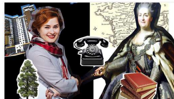
Звонок в прошлое

ПАРТНЕР: Tele2 ЗАДАЧА: подчеркнуть концепцию Tele2, который меняет правила мобильной связи ИДЕЯ: лидеры мнений (фотограф, ТВ-ведущая) рассказывают о проявлениях бунтарства.