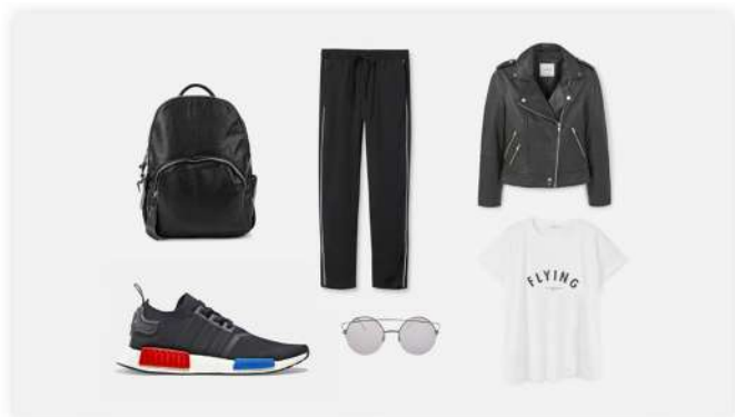
Три пары кроссовок, которые надо купить этим летом

ПАРТНЕР: Магазин Fresh sneakers. ЗАДАЧА: оповестить о летней коллекции. ИДЕЯ: составить топ-лист, чтобы привлечь внимание тех, кто интересуется трендами.