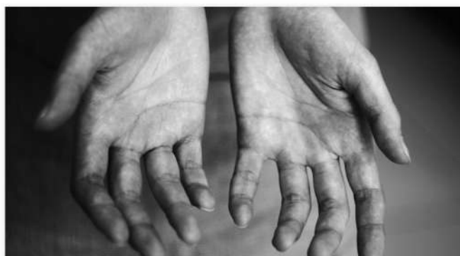
Фотопроект: как выглядят руки тех, кто ими работает

ПАРТНЕР: Магазин Fresh sneakers. ЗАДАЧА: оповестить о летней коллекции. ИДЕЯ: составить топ-лист, чтобы привлечь внимание тех, кто интересуется трендами.