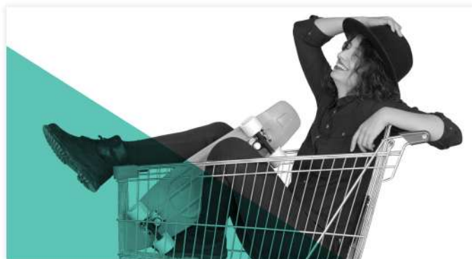
Стань бунтарем: истории тех, кто не хочет жить, как все

ПАРТНЕР: Сбербанк ЗАДАЧА: рассказать о преимуществах безналичных платежей ИДЕЯ: составить список бюджетных подарков и дать советы об оплате картой